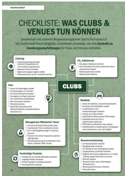
Abbildung 9

☞ Um zur Checkliste zu gelangen, bitte auf das Bild klicken.