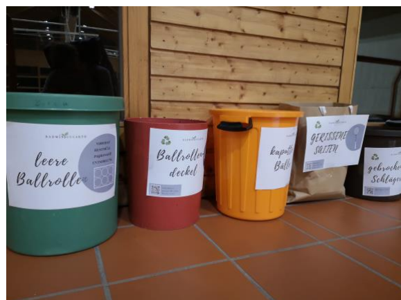
Abbildung 5

Der BC Grün-Weiß Oberzell (Bayern) veranstaltete im Jahr 2023 2 Turniere, bei denen nicht nur der Abfall recycelt wurde, sondern auch die anfallenden Materialien des Badminton Sports für das Recyclingprojekt von BadmintONEarth gesammelt wurden.