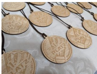
Abbildung 3 Medaillen vom BC G.W. Oberzell