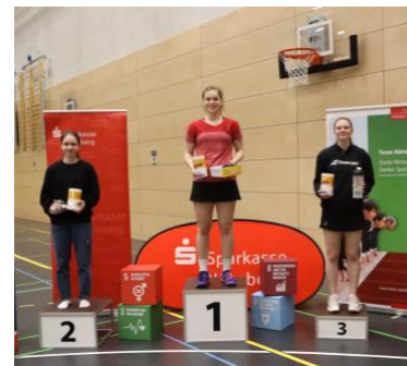
Abbildung 4

Bei der U17&U19 A-Rangliste im April 2023 in Nürnberg wurde vollständig auf Pokale verzichtet. Stattdessen gab es für die siegreichen Sportler:innen sinnvolle regionale Sachpreise! (siehe Bild rechts)