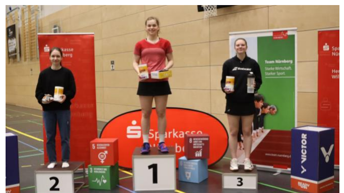
Abbildung 1 BBV, Lukas Gunzelmann

Im April 2023 veranstaltete Bayern ein nachhaltiges Ranglistenturnier U17 & U19. Dabei wurde komplett auf ausgedruckte Spielzettel und Urkunden verzichtet. Damit wurden nicht nur erhebliche Mengen an Papier eingespart, sondern insbesondere Prozesse und Abläufe für die Turnierleitung vereinfacht.