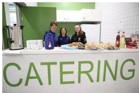
Abbildung 2