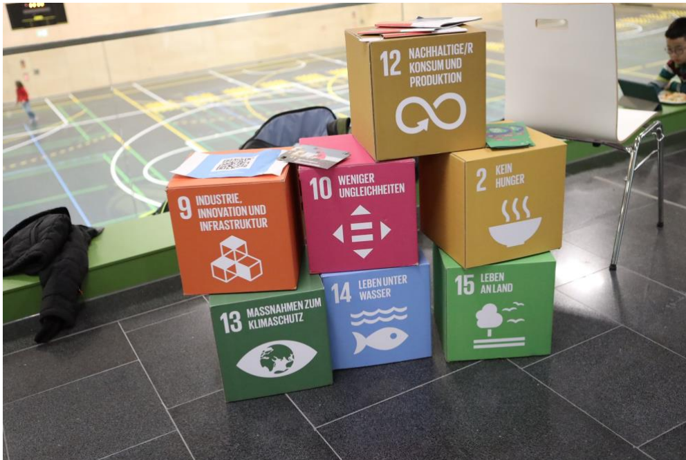
Abbildung 8