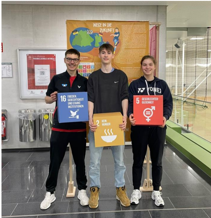
Abbildung 6 BBV Rangliste April 2023

Der Einsatz von nachhaltigen Bildungsangeboten während des Turniers leistet einen wichtigen Beitrag zur Sensibilisierung der Teilnehmer:innen.